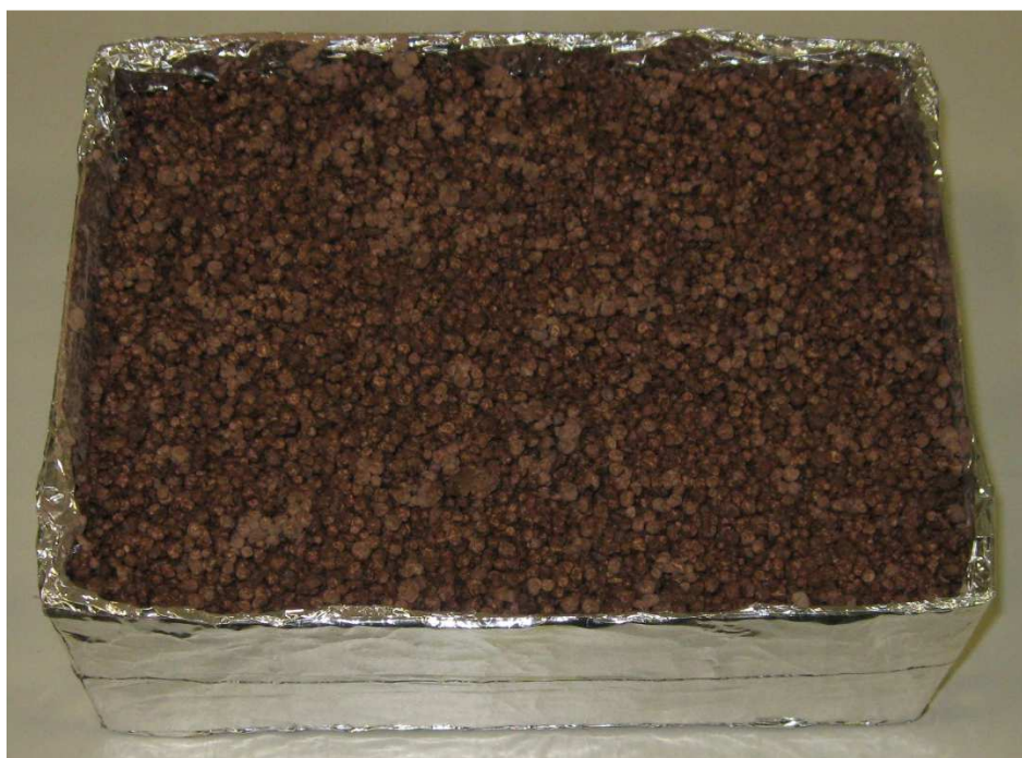
A002: thermotec BEPS-WD 130R

Hinweis: Die Untersuchungsergebnisse beziehen sich ausschließlich auf den vorgelegten Prüfgegenstand. Der Bericht verliert umgehend seine Gültigkeit bei Änderungen der Zusammensetzung oder des Produktionsverfahrens des Prüfgegenstandes. Eine vollständige oder auszugsweise Veröffentlichung des Prüfberichtes bedarf der Genehmigung.