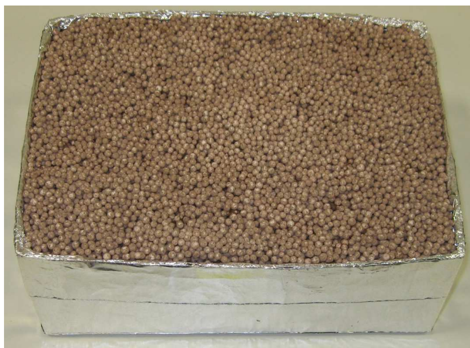
A003: thermotec BEPS-WD70N

Hinweis: Die Untersuchungsergebnisse beziehen sich ausschließlich auf den vorgelegten Prüfgegenstand. Der Bericht verliert umgehend seine Gültigkeit bei Änderungen der Zusammensetzung oder des Produktionsverfahrens des Prüfgegenstandes. Eine vollständige oder auszugsweise Veröffentlichung des Prüfberichtes bedarf der Genehmigung.