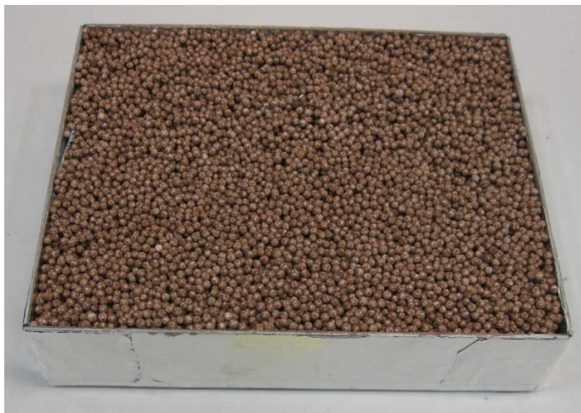
A001: thermotec BEPS-WD 90N rapid